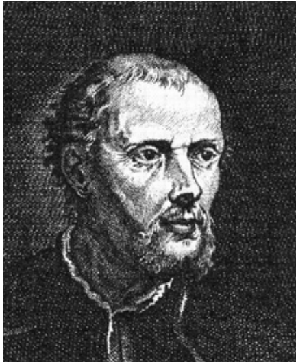
Fig. 1: Paracelsus. Kopergravure van F. Chauveau, 1658.