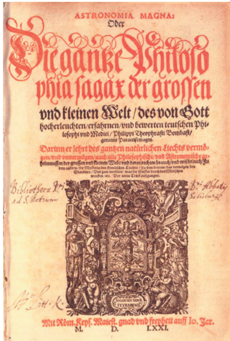
Fig. 2: Titelblad van de Astronomia magna , Frankfurt 1571.