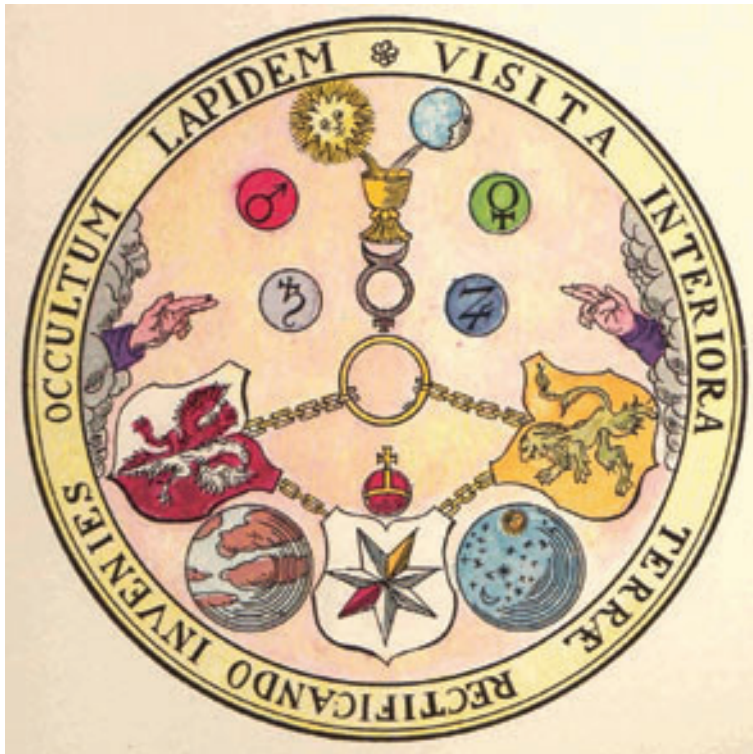
Fig. 4: Tabula Smaragdina Hermetis. Dit embleem sierde vele uitgaven van de Smaragden Tafel .

vinding als een hogere octaaf van de signatuurleer kunnen beschouwen: in de geneesmiddelproeven worden de stoffen als het ware op een systematische en reproduceerbare wijze gedwongen hun signatuur te openbaren.